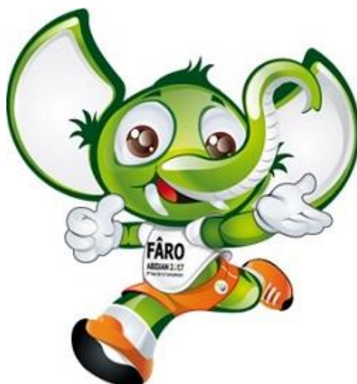
Fâro, la mascotte des Jeux