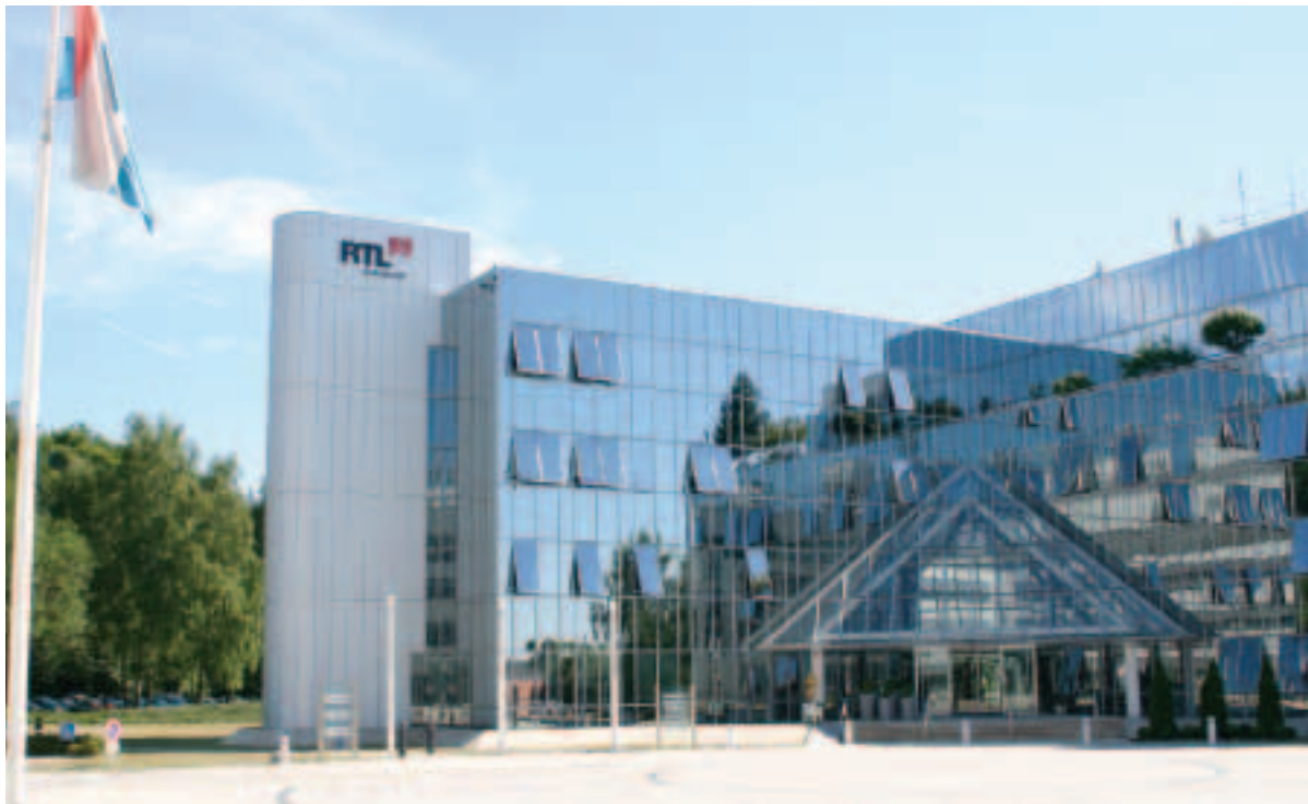
Les bâtiments de RTL Group situés au plateau de Kirchberg, Luxembourg

Sur le plan commercial, les rôles sont cependant clairement définis. Début des années 2000, Saint-Paul Luxembourg annonçait un chiffre d'affaires de 80 millions d'euros pour quelque 40 millions du côté d'Editpress Luxembourg.